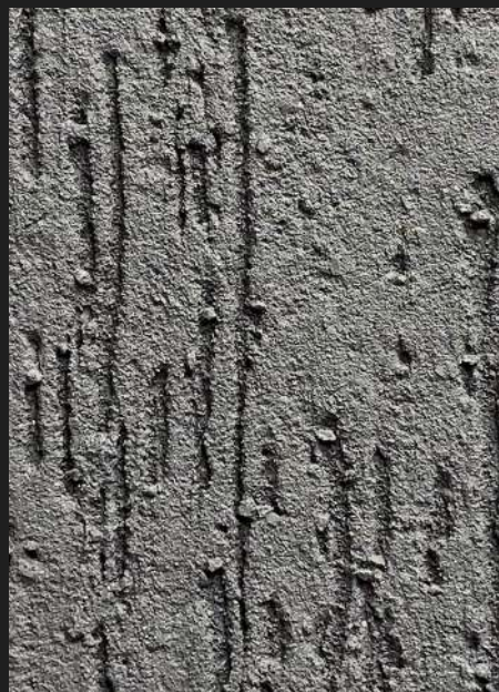
К103 / СЕРЫЙ