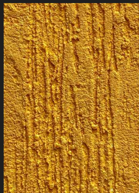
К504 / МАНГО