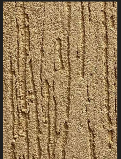
К303 / СВЕТЛО-КОРИЧНЕВЫЙ