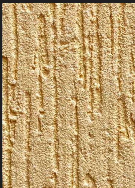
К503 / СВЕТЛЫЙ МАНГО