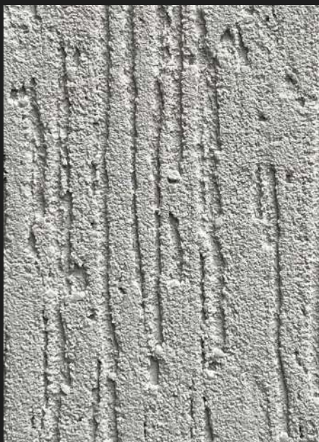
К102 / СВЕТЛО-СЕРЫЙ