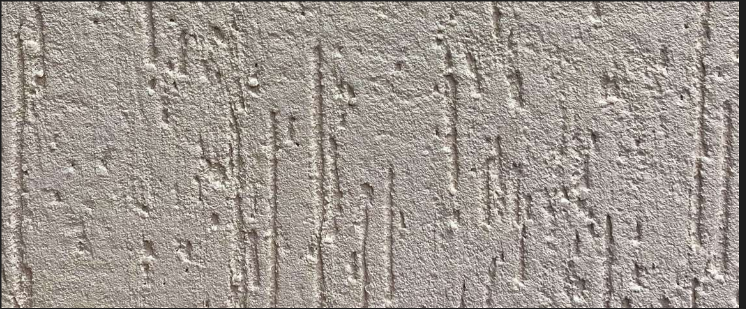
К201 / СВЕТЛО-БЕЖЕВЫЙ ХОЛОДНЫЙ