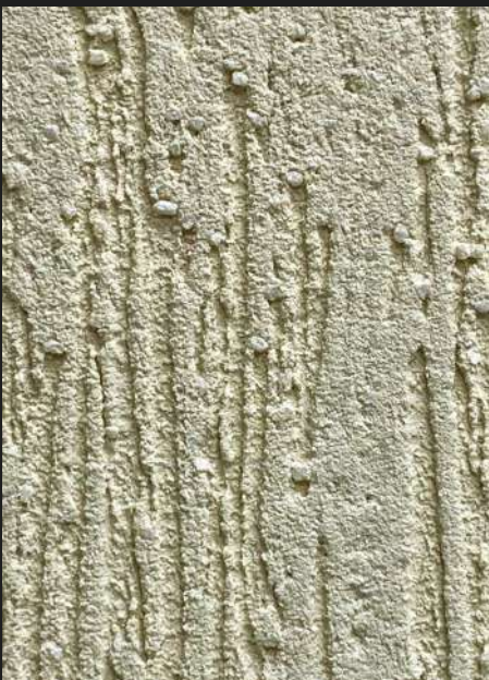
К301 / СВЕТЛО-БЕЖЕВЫЙ ТЕПЛЫЙ