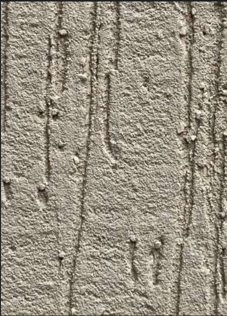
К202 / БЕЖЕВЫЙ ХОЛОДНЫЙ