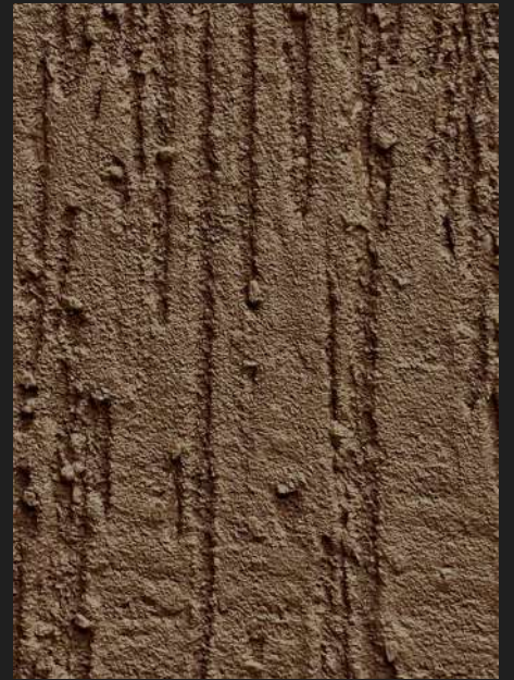
К204 / ТЕМНО-КОФЕЙНЫЙ