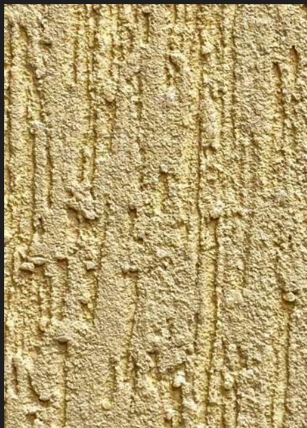
К302 / БЕЖЕВЫЙ ТЕПЛЫЙ