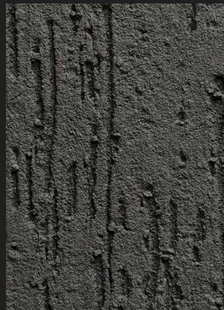
К104 / ТЕМНО-СЕРЫЙ (ГРАФИТ)