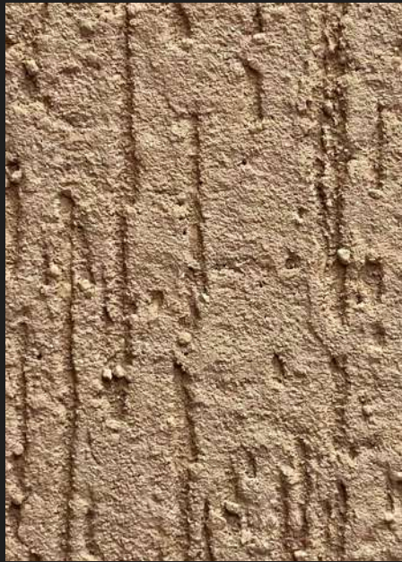
К203 / СВЕТЛО-КОФЕЙНЫЙ