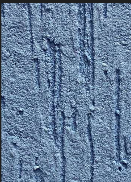
К702 / ГОЛУБОЙ